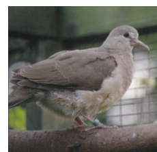
Gråpandet Jorddue (25 dage gammel )